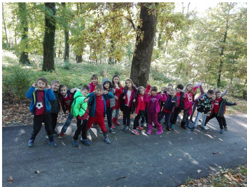
Prvašići u Gradu mladih

24.10.2017. 1.a , b i c posjetili su Grad mladih. Većinu vremena proveli su u igri i ponovili sve što su učili o jeseni. Vježbali su i socijalne vještine, rješavali različite zadatke, isprobavali nove aktivnosti, plesali, igrali se u prirodi. Idući dan u školi su crtali, rješavali listiće, organizirali radionicu: Bonton za stolom. Djeca su bila sretna, zadovoljna i povećala samopouzdanje, a učiteljice ponosne na svoje razrede.