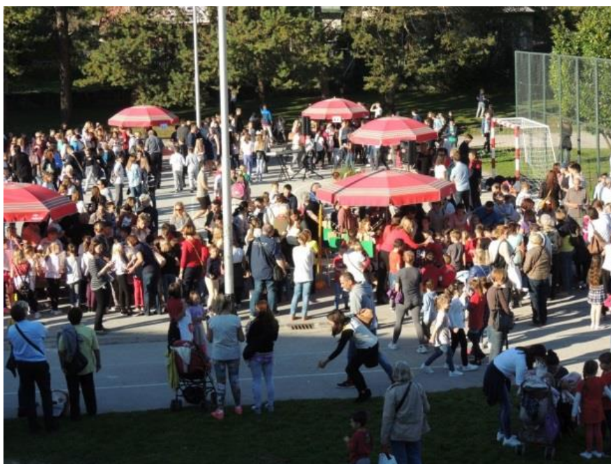
Dan kruha na školskom igralištu

U našoj školi tradicionalno obilježavamo Dane kruha i zahvalnosti za plodove zemlje. Kao i dugi niz godina, organizirana je prodajna izložba kruha, peciva, kolača i plodova jeseni. Događanje je započelo zazivom Božjeg blagoslova na sve okupljne kojeg je zazvao župnik don Rudolf Belko te je održan i kratki prigodni program.