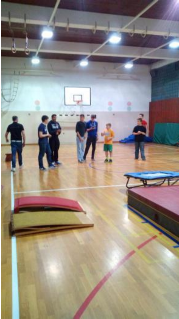
Državno natjecanje iz njemačkog jezika